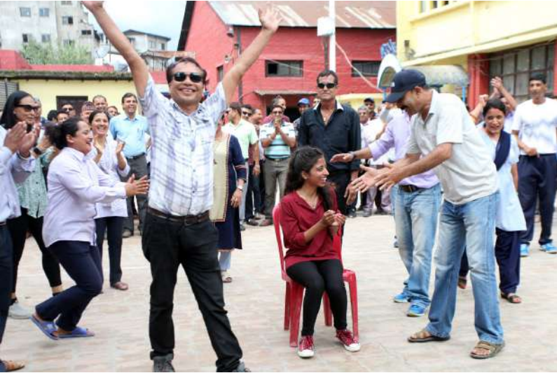
म्युजिकल चेयर खेलमा विजयी